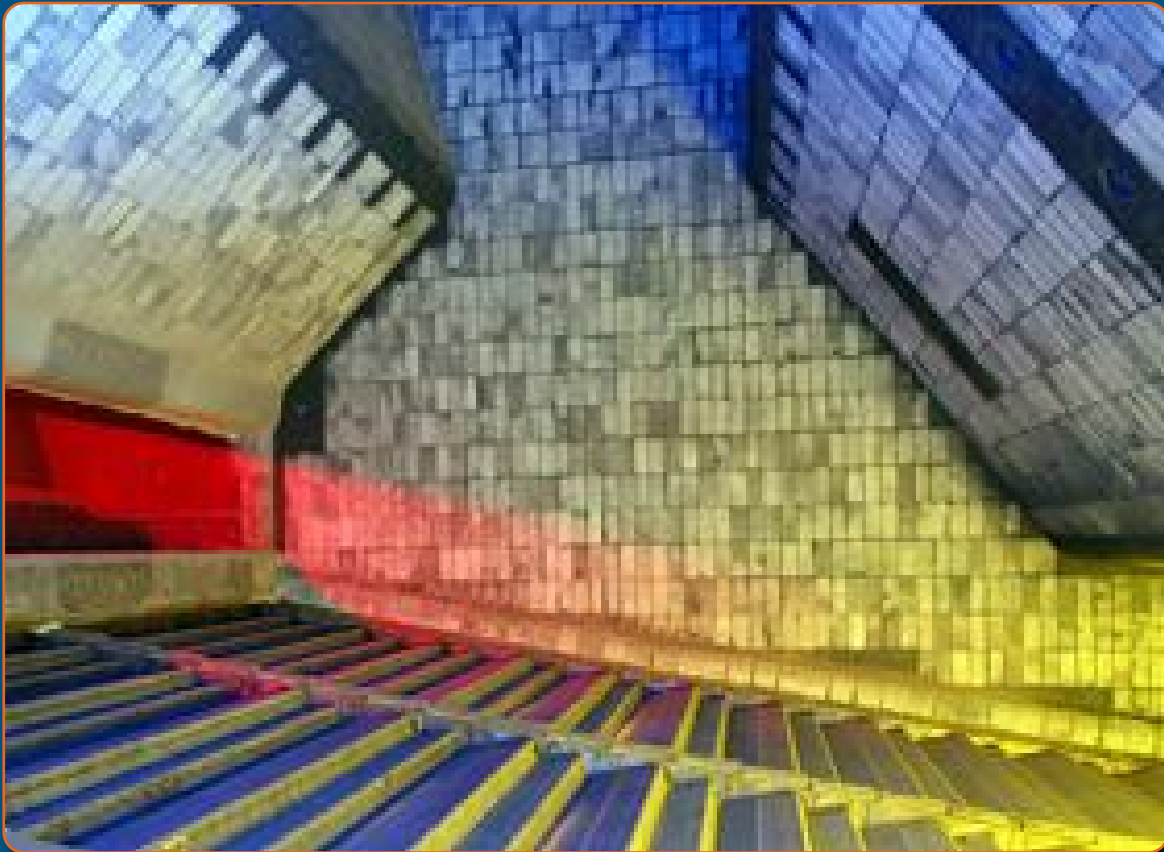
BILD: FEUERFESTE INDUSTRIEOFENAUSKLEIDUNG

Als modernes, weltweit agierendes Unternehmen im Feuerfestbau mit einer über 70jährigen Erfolgsgeschichte gilt die Firma Jünger+Gräter Refractories aus Schwetzingen (J+G) als Marktführer der Branche. Erfindungsgeist und Flexibilität zeichnen das Unternehmen aus. Jünger+Gräter ist so in der Lage, den Kunden optimale, individuelle und in Qualität und Ausführung unverwechselbare Lösungen zu bieten. Durch hohe Innovationskraft und Leistungsstärke lässt das Unternehmen positiv in die Zukunft blicken.